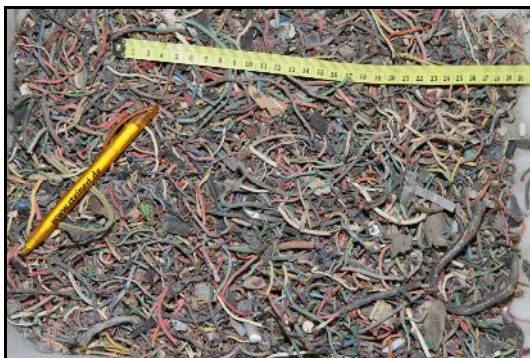
Προϊόν με 90% χάλκινα καλώδια

Το εισερχόμενο υλικό ήρθε από εγκαταστάσεις Τεμαχιστών(Shredders) στην Ευρώπη και ετέθη υπό επεξεργασία από τον εξελιγμένο εξοπλισμό της STEINERT . Το υλικό εισήχθη ξανά σε ένα διαχωριστή υψηλής συχνότητας Eddy Current για αφαίρεση των “χαμένων” μη σιδηρούχων μετάλλων και κατόπιν σε ένα ISS με αισθητήρες 12,5mm και πίδακες αέρα. Ειδικές τροποποιήσεις και το πιο εξελιγμένο λογισμικό που χειρίζεται τους αισθητήρες και τους πίδακες αέρα τέθηκαν σε λειτουργία. Επιπρόσθετα, το κανονικών διαστάσεων υλικό πέρασε από κόσκινο ώστε να αφαιρεθούν τα κυβοειδή κομμάτια των μη σιδηρούχων μετάλλων.